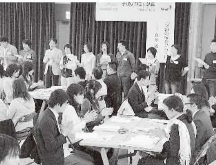
堺教組 4月5日 新歓「学級びらき講座」(堺市内)