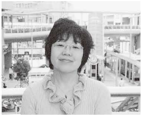
「豊中教職員九条の会」は、05年組合の枠組みをこ