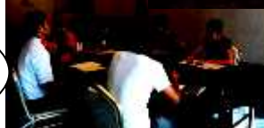
二部の交流会も盛り上がりました!!